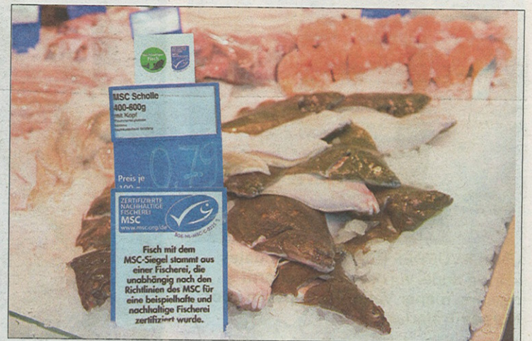
MILJØMERKE: MCS er et velkjent miljømerke for miljøbevisste forbrukere.